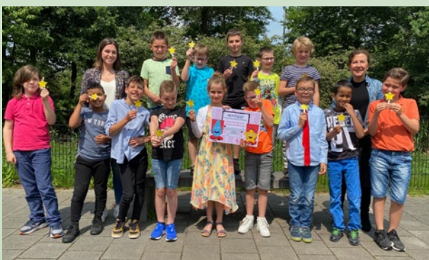
De kinderen van SBO Westerwel zijn trots op hun ontwerp van Yellow!

Yellow is een ontwerp van kinderen van SBO Westerwel in Tilburg. Deze school deed in 2019 mee aan de ontwerpwedstrijd voor basisscholen. Andere winnaars van de wedstrijd waren twee groepen van basisschool Wandelbos in Tilburg.